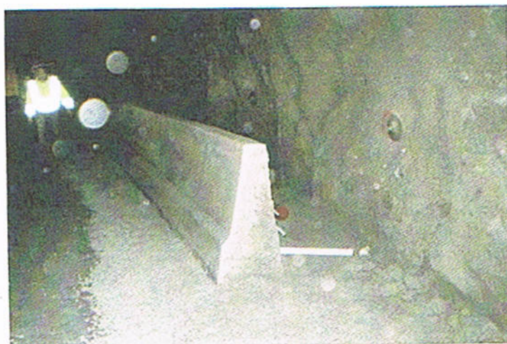
Rekkverk støpt med Gomaco GT-3600 i tunnel på riksvei 80 mellom Bodo og Fauske.