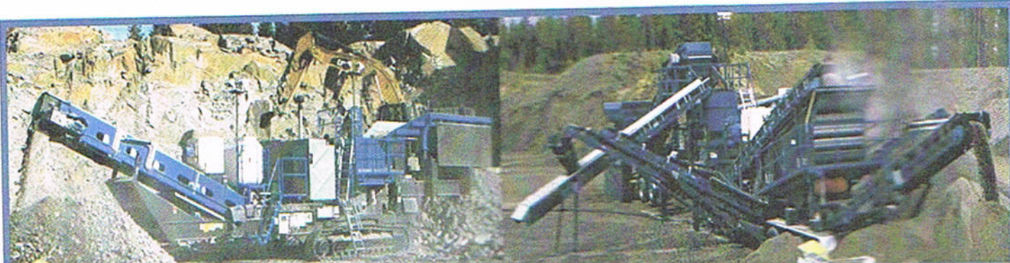
Jonsson L 1208 el.